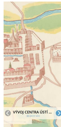
Phone 7 / 6s / 6